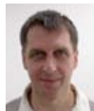
MÉDIÁ: MÁRIO PORUBEC