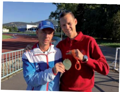
Zlato zavítalo na chvíľku aj do Nitre, do rúk človeka, ktorý má na ňom veľký podiel – môj prvý chodecký tréner, povedal Maťo