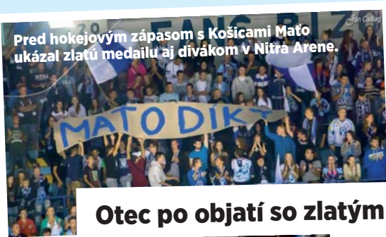
Pred hokejovým zápasom s Košicami Maťo ukázal zlatú medailu aj divákovi v Nitre Arene.

„Pamätám si, ako by to bolo dnes, keď sme si s Matejom Tóthom vymieňali podpisové karty. Navštívili naše ministerstvo na Deň otvorených dverí a strávili sme spolu príjemné chvíle v zaujímavom rozhovore. Matej je nielen skvelý športovec, ale aj vzdelaný, príjemný mladý muž a láskavý otec rodiny. Máme veľkú radosť z jeho úspechu. Prvý majster sveta v atletike od vzniku SR, výborná reprezentácia našej krajiny. Matej, gratulujem!“